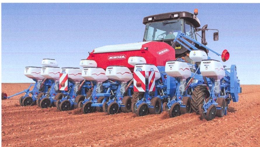
Le portefeuille de marques de GVS-Agrar s'enrichit, grâce à la reprise de Bovet SA, des produits Sulky et Monosem entre autres.