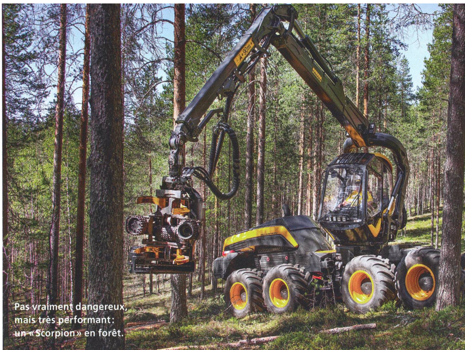
Pas vraiment dangereux, mais très performant : un « Scorpion » en forêt.