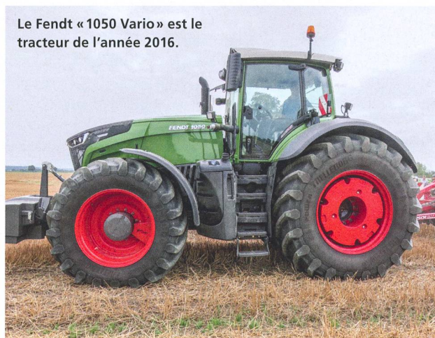
Le Fendt « 1050 Vario » est le tracteur de l'année 2016.

Fendt, Massey Ferguson, Valtra et Same sont, cette année, les récipiendaires des prix remis chaque année par 23 journalistes dans le cadre du concours « Tractor of the Year ». Sur la première marche du podium pour 2016 se trouve le Fendt « 1050 Vario », qui a convaincu le jury par son concept d'ensemble, plus que par sa taille et ses 500 chevaux. Same remporte le trophée du tracteur spécial avec le « Frutteto S 90.3 » et sa transmission « ActiveDrive ». Le Valtra « N174 V » gagne le prix de l'esthétique (« Golden Tractor of Design »). Pour la première fois, un prix du meilleur tracteur polyvalent (poids total en charge de 8,5 t au maximum) a été décerné ; il échoit au Massey Ferguson « 5713 SL ».