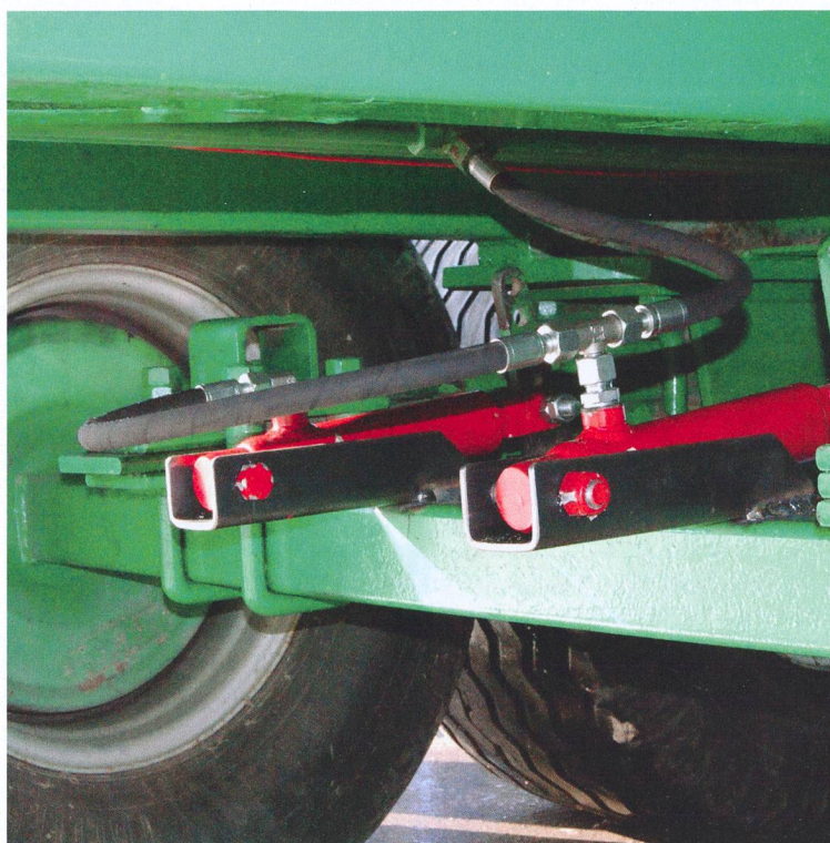
Pour rouler en toute sécurité, l'AFETA maintient la campagne de contrôle des freins pour les chars et remorques en 2015.