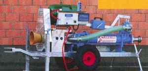
Pompes à vis