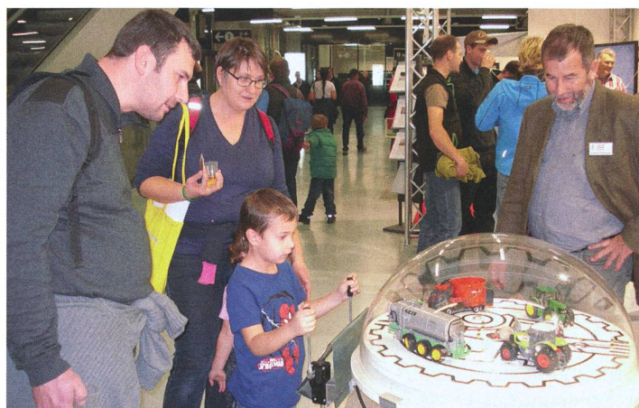
Au stand ASETA de l'AGRAMA 2014, les jeunes abordent les thèmes agricoles de manière ludique.