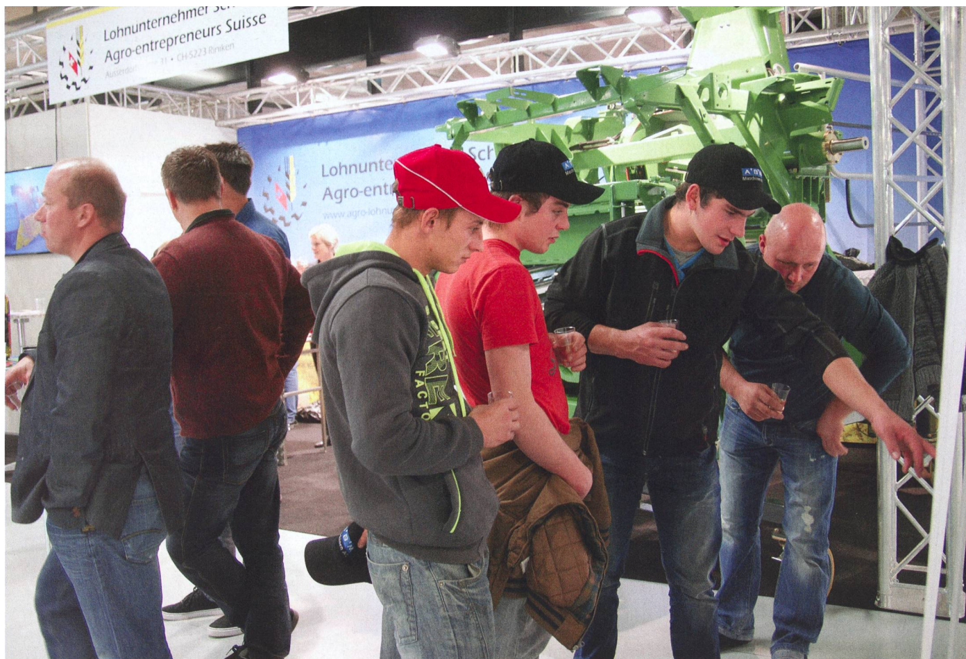
Les panneaux d'information du stand AGRAMA d'Agro-entrepreneurs Suisse suscitent l'intérêt des jeunes agriculteurs.