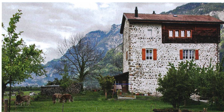
La solide maison familiale, à la Schweinsberggasse à Attinghausen.