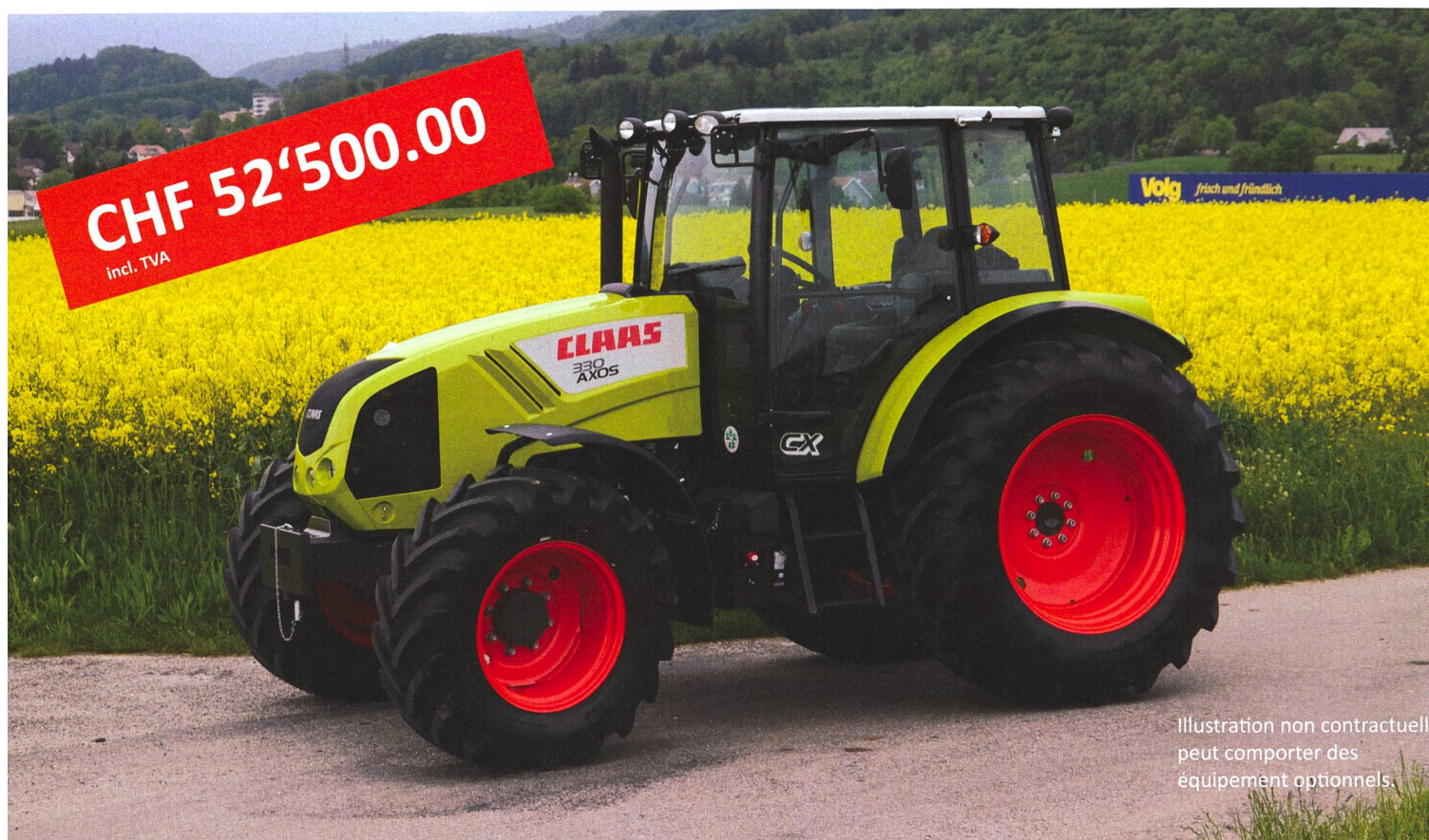
Illustration non contractuelle peut comporter des équipement optionnels.