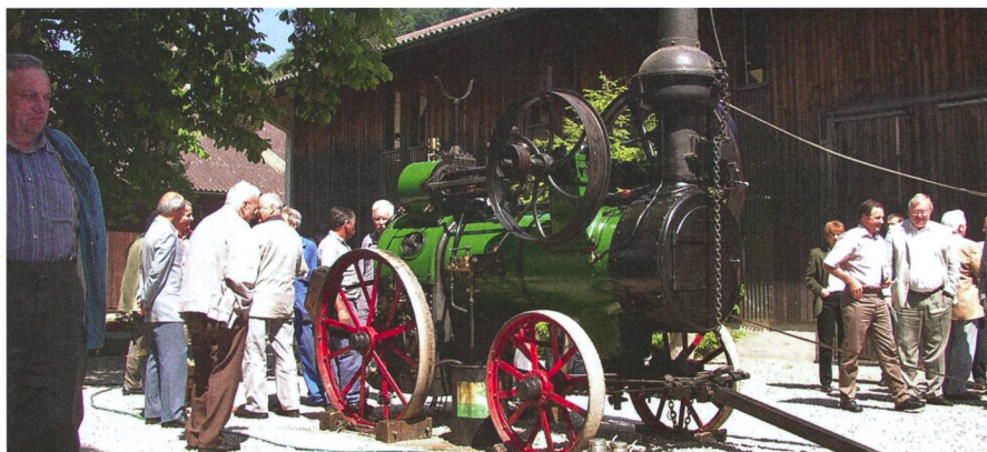
Le Musée du Burgrain raconte l'évolution de la mécanisation agricole en Suisse.

Sur demande, des visites commentées peuvent être organisées toute l'année, en français, en (suisse) allemand ou en anglais.