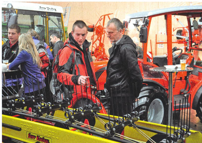
Les machines jouent un grand rôle comme facteur de productivité au salon Tier&Technik, qui se déroule à Saint-Gall du 20 au 23 février 2014.

La 14 e édition de Tier&Technik aura lieu du 20 au 23 février 2014 à Saint-Gall. Ce salon international est consacré à l'élevage des animaux de rente, à la production agricole, aux cultures spéciales et à la technique agricole.