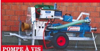
POMPE À VIS