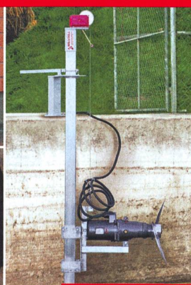
BRASSEUR À PURIN IMMERGÉ