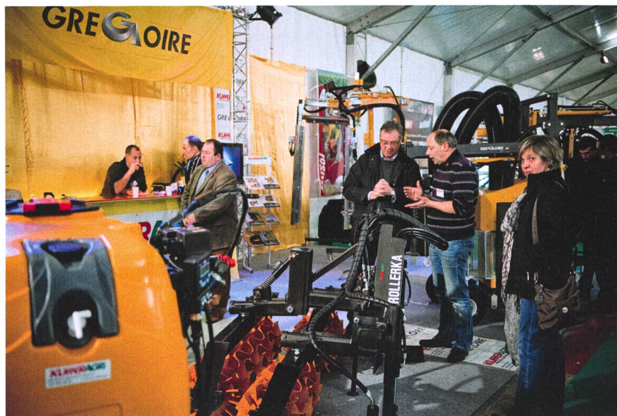
Agrovina réunit sur 20000 m 2 près de 220 exposants qui exposent à leurs 17000 visiteurs tous les produits, services et technologies propres aux exploitations situées dans l'arc alpin.