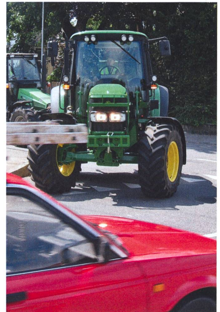
L'allumage des feux de croisement est obligatoire lors des cours de conduite G40.

Quand il est impossible de monter de feux de jour, on recommande d'installer un système d'allumage automatique des feux de croisement avec la clé de contact pour éviter les oublis. Cette