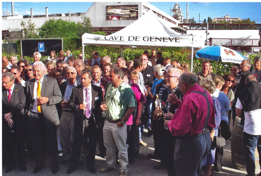
L'agréable sortie dans les vignobles genevois est conclue par un apéritif de bienvenue à la Cave de Genève à Satigny, la commune dotée de la plus grande surface viticole (500 ha) de Suisse. La manifestation a été animée par la formation «L'Echo du Signal de Bernex» (GE).