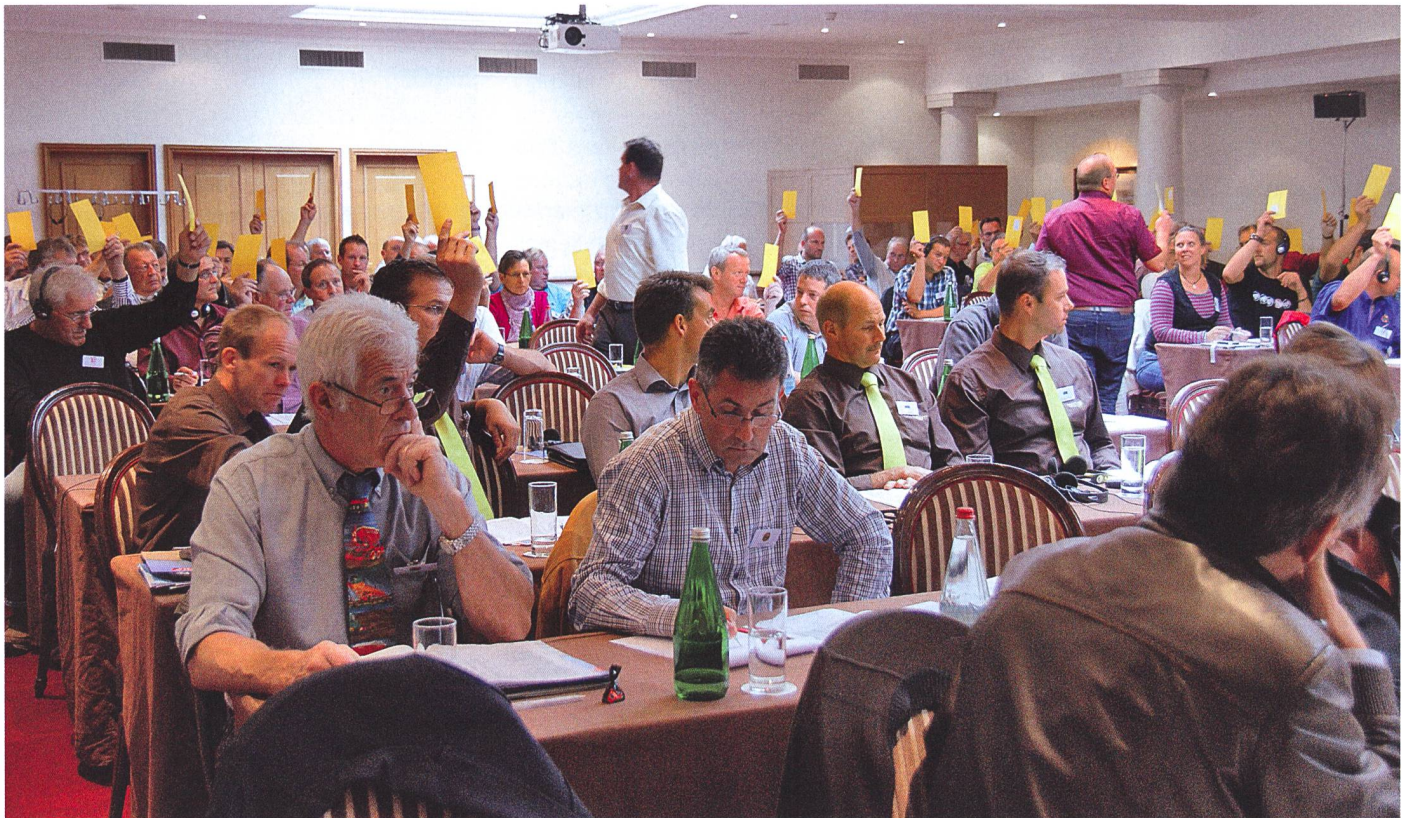
L'Assemblée des délégués de l'ASETA à Genève. Les scrutateurs ont beaucoup de travail !