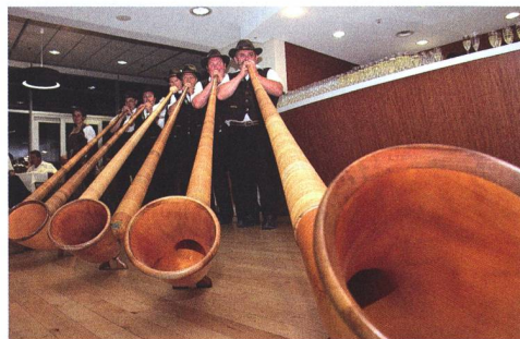
Le groupe les Tradi'son de Haute-Savoie (F) ont émis de la gaité avec leur vaste répertoire et leur jeu aérien.