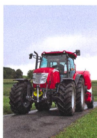
Page de couverture: Prise en main du McCormick X50.40