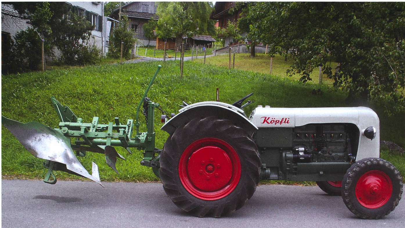
Le Köpfler Trumpf de 1955 avec charrue d'Heinrich Wandeler à Gunzwil/Beromünster (LU).