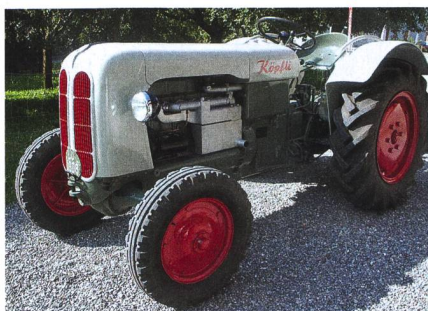
Le nouveau tuyau d'échappement « crache » comme à l'origine.

la coupure des gaz, le levier de commande saute sous la force d'un ressort dans la position sélectionnée, et la transmission adhère sans interruption – un gros avantage dans les côtes.