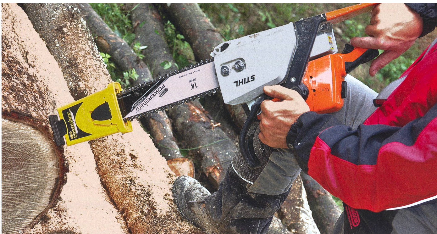
Le « pied » du boîtier du PowerSharp est appuyé contre un support solide et la machine est lancée quelques secondes à plein régime.