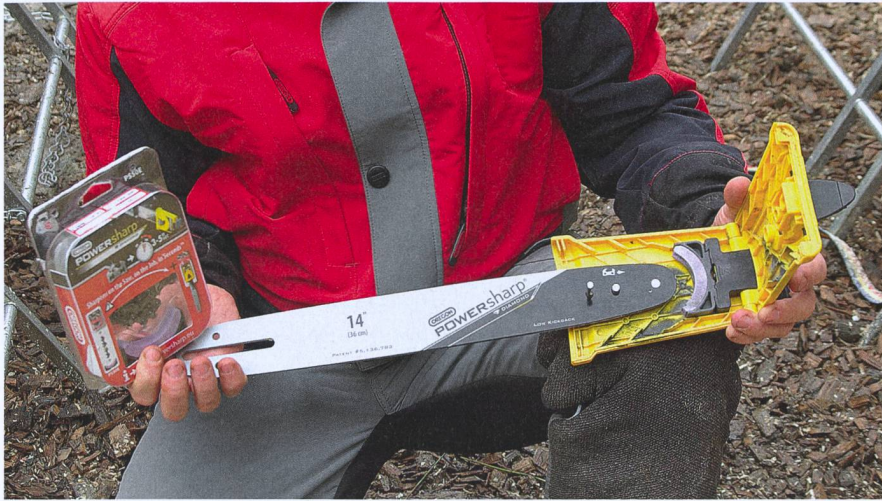
Le dispositif est composé de quatre éléments : une chaîne, un plateau et la pierre à aiguiser contenue dans le boîtier jaune.

adresses est assez limité et les fusions entre services forestiers influencent les besoins en matériel. Nous le ressentons, de même que l'effet du franc fort.