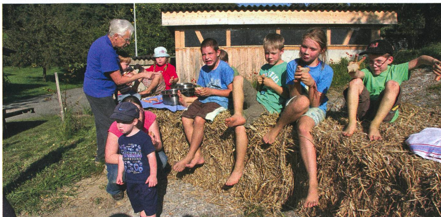
Ces enfants réunis sagement pendant le pique-nique partiront ensuite probablement individuellement à la découverte.

pas la possibilité de les voir. Les conditions de visibilité ne sont pas les mêmes pour un chargeur automoteur, un tracteur ou un chariot élévateur. Par mesure de prévention, les enfants peuvent être vêtus de gilets luminescents ou d'habits avec des bandes réfléchissantes. Ainsi, on les voit mieux et ils sont en général fiers d'être « lumineux ». De plus, les adultes devraient veiller à effectuer leurs travaux en marche avant dans la mesure du possible, parce que la plupart des accidents se produisent en reculant.