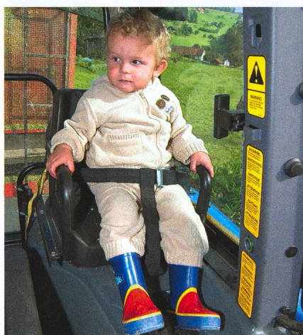
Le siège pour enfants est obligatoire pour les enfants de moins de sept ans.

Toutes les zones présentant un risque de chute doivent être protégées par des barrières assurant la sécurité des enfants, composées de lattes verticales, de barreaux ou de fils tendus par des poteaux à intervalle de 12 cm au maximum. Les escaliers comportant plus de quatre marches