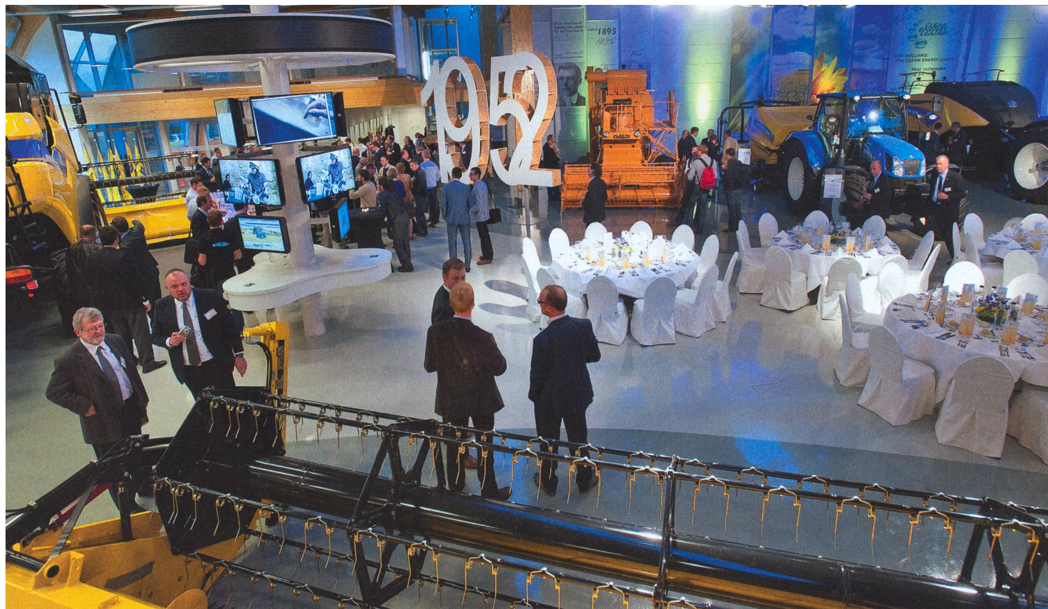
Dans le spacieux local de démonstration, le visiteur est plongé dans l'univers de New Holland de façons virtuelle et concrète au moyen d'une vingtaine de machines de pointe.