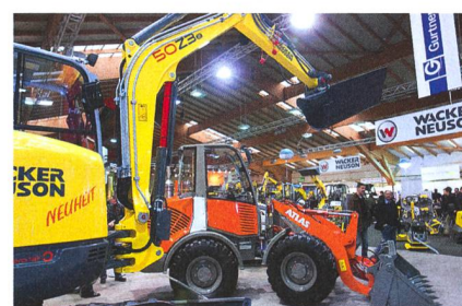
La 16 e foire pour machines de chantier Baumag 2013 Luzern vous attend avec de nombreuses nouveautés de machines de chantier.

Très populaire, le concours de petits trax composé de plusieurs disciplines promet du suspense et de l'amusement pour les adultes et les enfants. Ce concours original est organisé et présenté par « Baublatt ». Les trois conducteurs les plus habiles recevront des prix d'une valeur totale de 1000 francs. (pd)