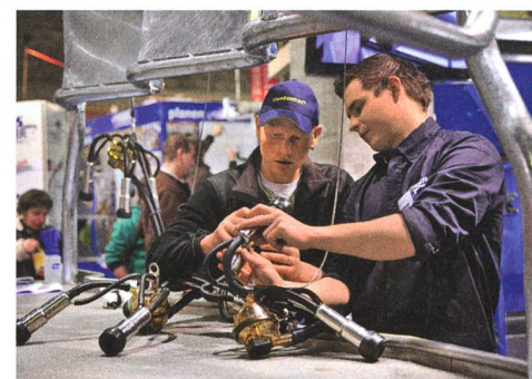
La priorité est cependant donnée au bétail laitier.

Tier&Technik est aussi l'endroit idéal pour partager ses connaissances professionnelles avec des collègues, discuter des nouvelles tendances et vivre des moments conviviaux. ■