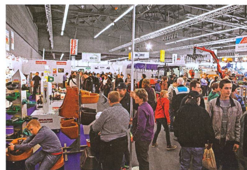
L'agriculture de montagne et les abeilles sont les pôles d'attraction de la 13 e Agrimesse de Thoune.

Les abeilles mellifères ont une importance cruciale pour l'écologie, l'agriculture et l'économie. Outre leur production de miel, elles jouent un rôle pilier pour la pollinisation des cultures fruitières et du colza, très utile pour l'économie, grâce à leur instinct qui les pousse à collecter le pollen. Elles contribuent aussi grandement à la biodiversité. La contribution économique estimée des « insectes d'or » s'élève dans le canton de Berne à quelque