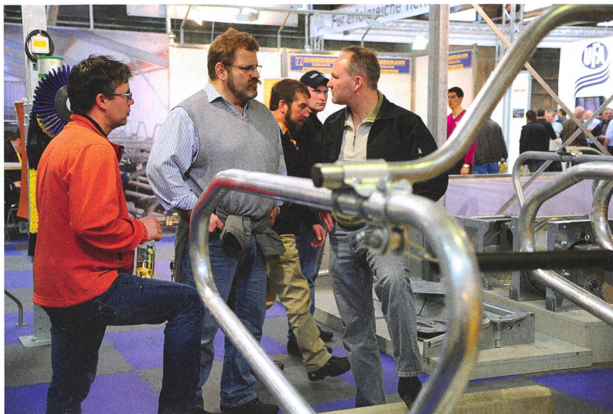
Le Tier&Technik est un lieu de rencontres et d'échanges, comme ici dans le secteur d'équipements de ferme et de stables.