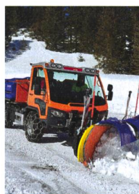
Prise en main: Aebi VT450 Vario