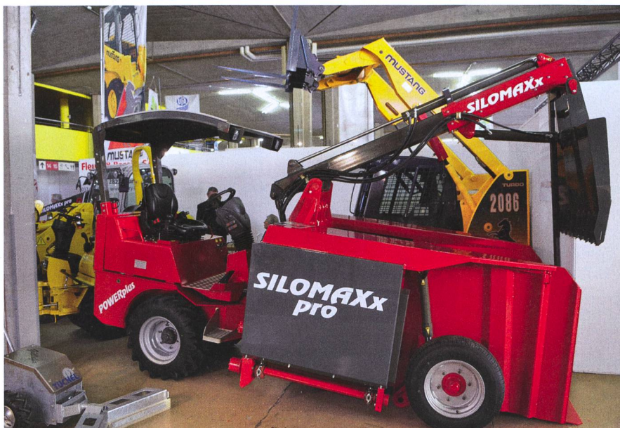
SWISS EXPO est la plateforme incontournable des nouveautés en Suisse romande.