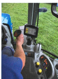
Test de tracteur exhaustif sur le New Holland T7.210