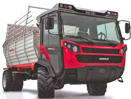
En tête des inscriptions du troisième trimestre 2012 : le transporteur Muli T 10 X de Reform.