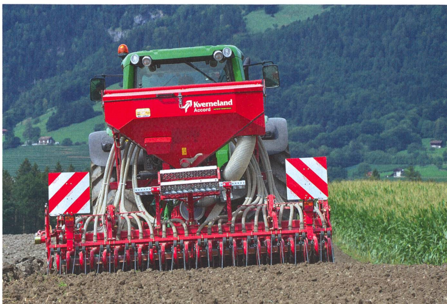
Le semis des céréales constitue la base de la récolte suivante. Un effet positif sur la santé des plantes est exercé avec le broyage.

ART conclut que l'infestation de fusariose sur le blé reste moindre avec un broyage fin après ses essais. En ce qui concerne la forme des fléaux, ART n'a trouvé aucune différence quant à l'infection de fusariose et mycotoxines (DON). En raison de la qualité de travail similaire, mais avec des besoins plus faibles de puissance, les fléaux en Y avec dispositif de nettoyage offrent une alternative intéressante aux fléaux à marteaux. Selon les méthodes de récolte, ce sont de 30 à 50 % des chaumes de maïs qui sont écrasés. Ceux-ci ne sont traités de manière satisfaisante par aucun broyeur et ne peuvent donc