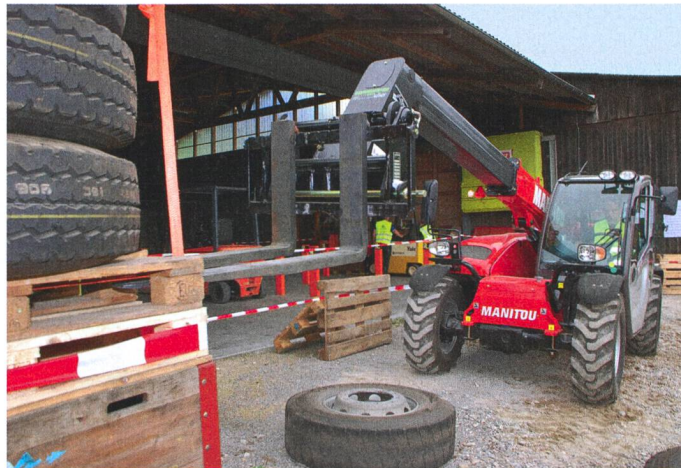
Exercice pratique : positionner la fourche avec une précision au centimètre près.

ments. Les déplacements de charges se font – suivant le degré de difficulté – avec des paloxes ou avec des palettes. Avec les deux chariots à contrepoids et deux téléscopiques à disposition, les participants au cours sont en situation de pratiquer les mesures de sécurité et d'appliquer les principes du déroulement du travail. A mesure qu'ils avancent dans le cours, les participants se voient confrontés à des tâches toujours plus délicates, les éléments étant régulièrement adaptés à leurs progrès. Ils arrivent ainsi progressivement à une maîtrise de leurs machines au niveau des exigences de l'examen.