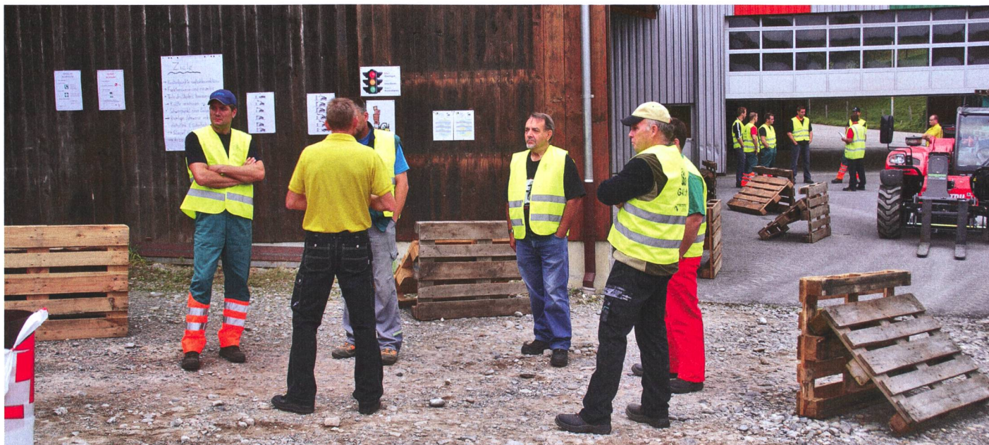
Alternance de l'enseignement théorique (au premier plan) et pratique (dans le fond) lors du cours de caristes organisé dans l'entreprise Hirter & Tschanz SA, chaque fois pour une heure.