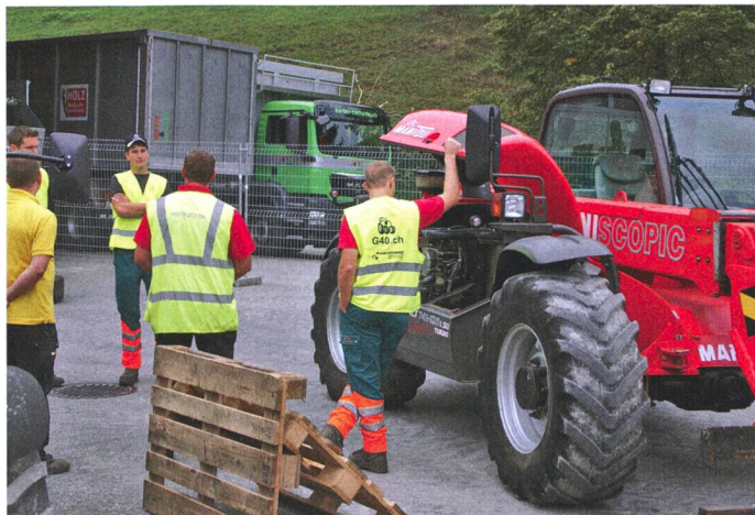
Les explications sur la motorisation font partie du programme de la partie théorique.