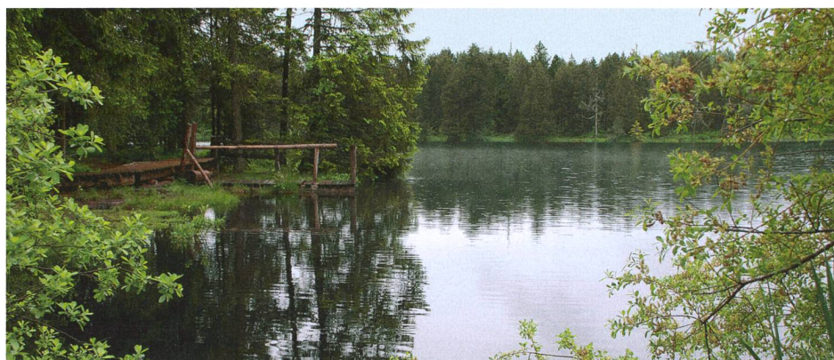
A proximité de Chaumont, l'étang de la Gruère, site protégé avec le Centre Nature « Les Cerlatez », musée et boutique.

Pour se restaurer, une cantine spacieuse sera à disposition du public et des participants. Informations relatives aux parcours, règlements et palmarès: Secrétariat ASETA, Riniken, 056 462 32 30. ■