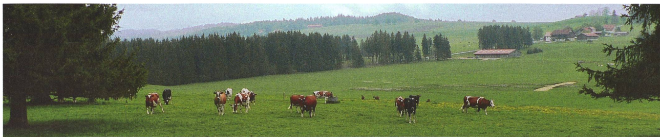
Le haut plateau des Franches Montagnes, un panorama exceptionnel.