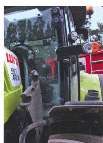
La nouvelle série Claas Arion 500/600 (page 44).