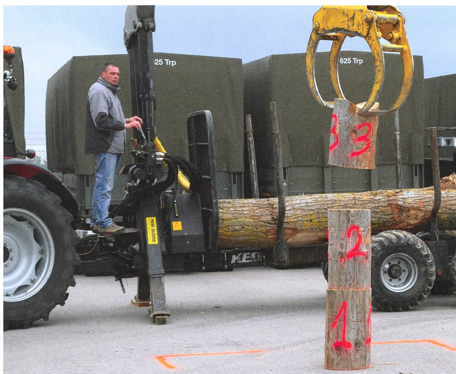
Bel exercice d'équilibre: à l'aide de la grue forestière, les candidats doivent empiler trois rondins et placer à leur sommet une traverse.

Braillet Olivier, Nierlet-les-Bois (277)