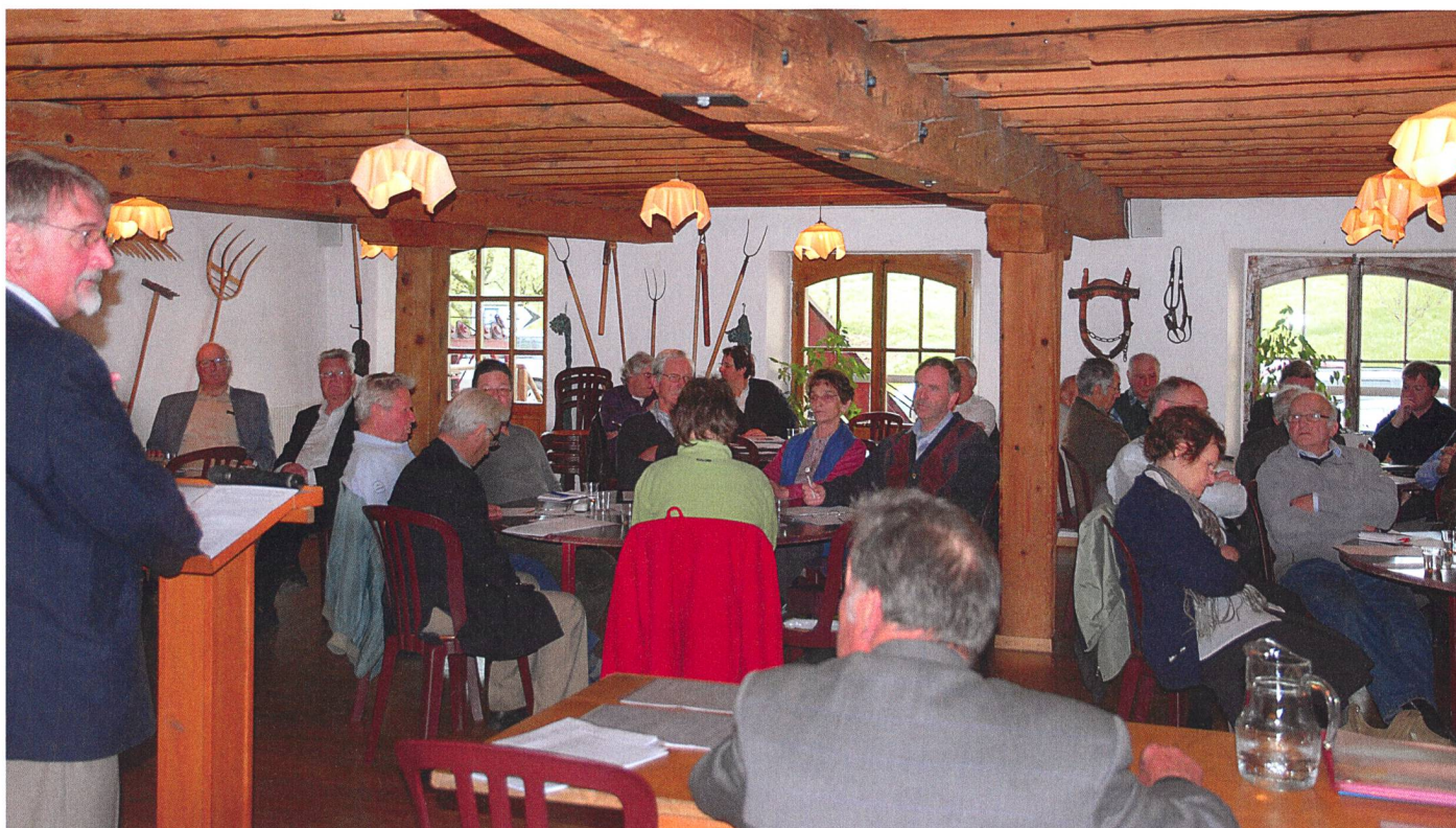
C'est dans la très belle salle des banquets du Moulin de Chiblins que s'est tenue, en présence d'une septantaine de membres, l'assemblée générale.