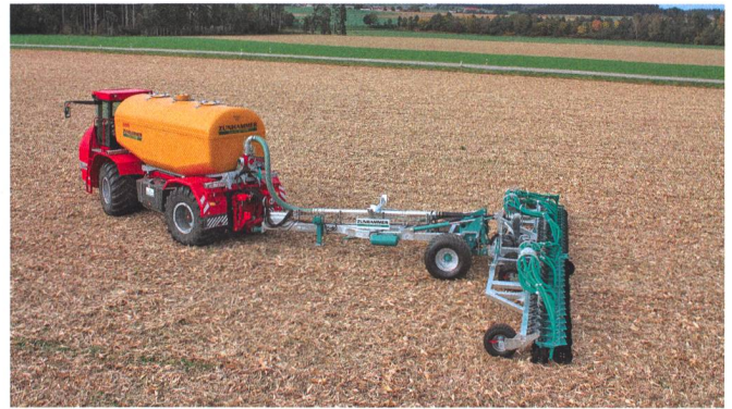
Avec cette nouveauté, l'injecteur à disques attelé «Zunidrill Mobil», Zunhammer est parvenu à réduire sensiblement le poids de l'essieu arrière de l'automotrice.

automotrices. Les trois agro-entrepreneurs que nous avons interrogés prétendent cependant le contraire: «Sur