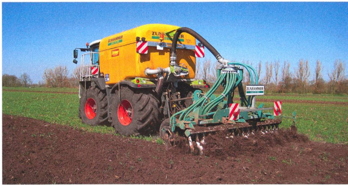
Les herse à disques compactes exigent une vitesse de travail de 12 à 15 km/h et, par conséquent, une puissance élevée. (Photo d'usine)