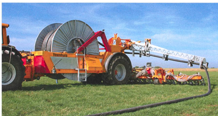
L'«Enrouleur de tuyau Rotomax» de Veenhuis permet, grâce à un long bras, d'utiliser un injecteur à disques alimenté par tuyau. Cela pourrait constituer une solution pour les automotrices également.

chine suffisamment de temps. « En tant qu'agro-entrepreneur en Suisse, nous devons être beaucoup plus souples, raison pour laquelle le changement d'équipement n'entre pas en ligne de compte », précise Markus Schneider. Par ailleurs, toutes les automotrices ne sont pas aussi bien adaptées pour les travaux de traction lourds. Alors que les véhicules disposant d'un entraînement hydrostatique pur sont moins bien adaptés aux lourds travaux de travail du sol, les