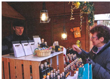
Dans son assortiment, un choix exclusif de vinaigres au vin blanc, un aceto meleco ainsi que d'autres vinaigres issus de fruits et de baies.

portance de cette démarche, surtout pour les entreprises de travaux à façon.