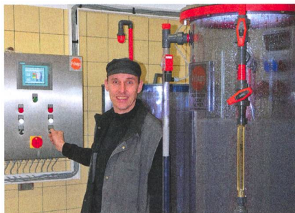
La toute dernière installation de fermentation pour le vinaigre, qui permet aussi de travailler pour des tiers.