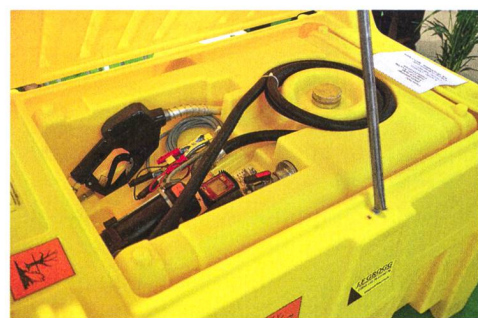
Cette citerne à diesel de 220 litres est contenue dans un bac de rétention conforme aux exigences suisses. Des versions pour l'essence devraient voir le jour.