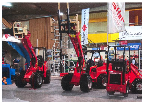
L'exposition réunit essentiellement des entreprises ou des succursales romandes. Ici la maison Roth de Porrentruy.

L'espace consacré à la technique agricole gagne en diversité et réunit environ 120 entreprises et succursales, romandes pour l'essentiel. Pour certaines, SwissExpo est le seul salon où elles exposent. Et pour