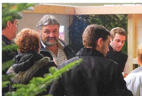
Encore modeste, conçu comme un lieu de rencontre entre forestiers et agriculteurs, l'espace forestier a attiré ses premiers visiteurs.