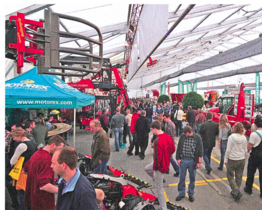
L'AgriMesse à Thoun, une foire prometteuse.

L'un des événements importants de cette édition sera l'exposition d'anciennes machines agricoles avec des démonstrations quotidiennes. Le parking est gratuit tout comme le park-and-ride. L'entrée est gratuite pour les jeunes de moins de 16 ans. ■