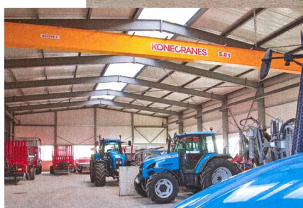
▲ La nouvelle place d'exposition joute la route du village.