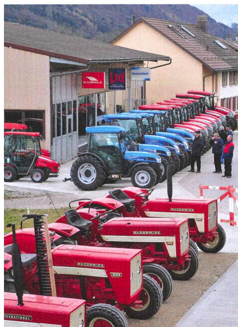
McCormick est une marque de vieille tradition! Notez la présence de deux Valpadana de dernière génération, à gauche de l'image.