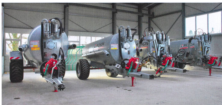
Pichon figure au catalogue de Stauffer. La marque française est notamment réputée pour ses citernes et ses systèmes d'épandage.

Le groupe Argo est en mains de la famille Morra, industriels du nord de l'Italie. Ils avaient racheté, en 2001, la marque McCormick et deux usines au groupe CNH. Cette intégration ne s'est pas réalisée sans mal. Argo a finalement dû fermer l'usine de montage McCormick de