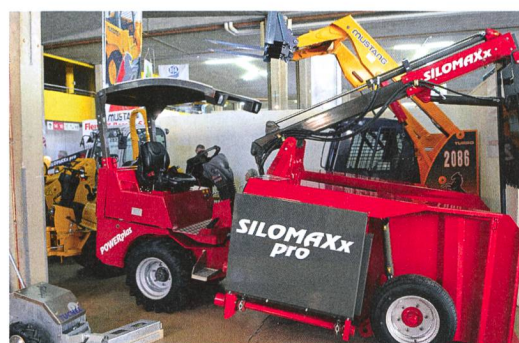
SWISS EXPO: Un salon qui allie l'agrotechnique à un concours bovin international.

Transports publics de la région lausannoise : Le Centre de congrès et d'expositions de Beaulieu se trouve à 10 minutes en bus de la gare CFF de Lausanne (lignes 2, 3 et 21). Venir à Beaulieu en voiture : Autoroute direction Lausanne-Nord, sortie Vennes ou Blécherette. Suivre panneaux « Beaulieu ». Parking souterrain de Beaulieu uniquement payant.