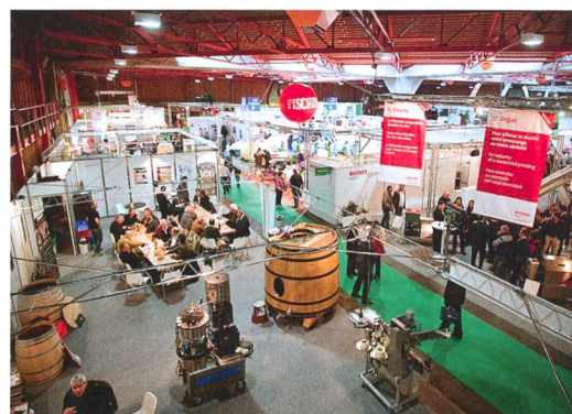
A Martigny, plus de 200 exposants proposent de nouvelles technologies viticoles