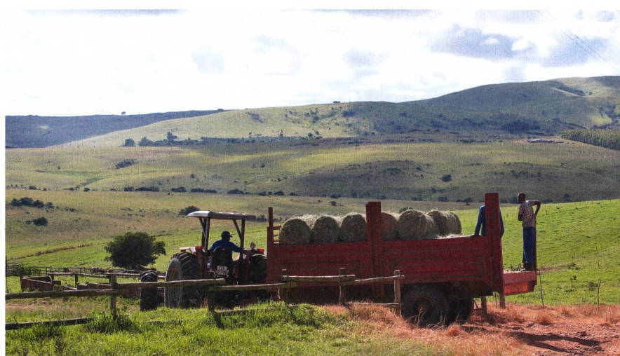
Agriculture: Des machines agricoles robustes pour alléger les travaux.

Au programme du jour, une visite du township. Tôt le matin, nous suivrons un guide touristique. A l'époque de l'apartheid, ce township a été spécialement construit pour les populations noires, asiatiques et indiennes. Aujourd'hui encore, les townships ont les dimensions de villes moyennes et sont généralement situés en bordure de la cité. Les différentes habitations, les « cabanes de planches » ou « baraques » sont le plus souvent construites au hasard. Ensuite, cap sur le