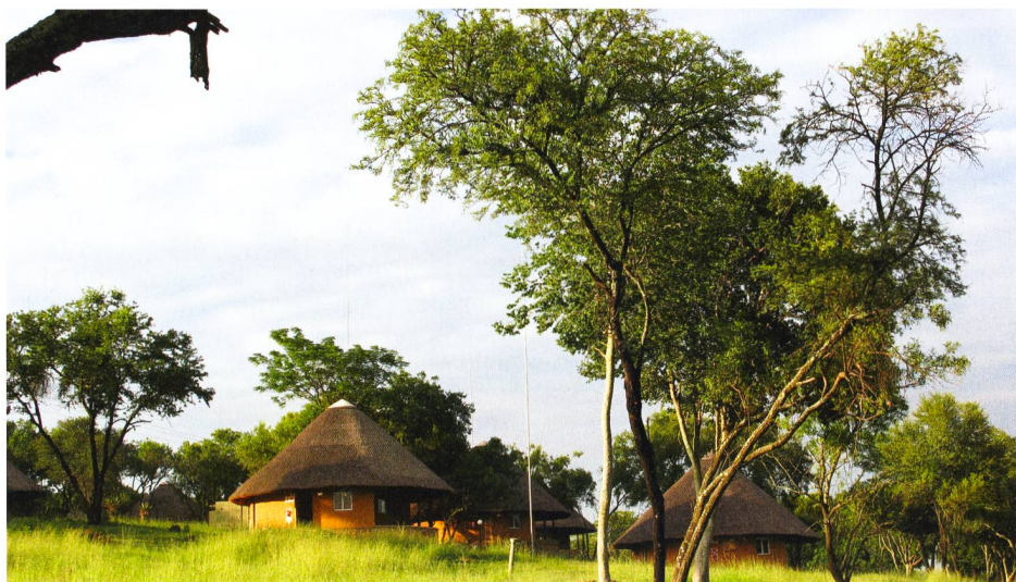
Premier hébergement des participants en Afrique du Sud au Heia Safari Lodge.