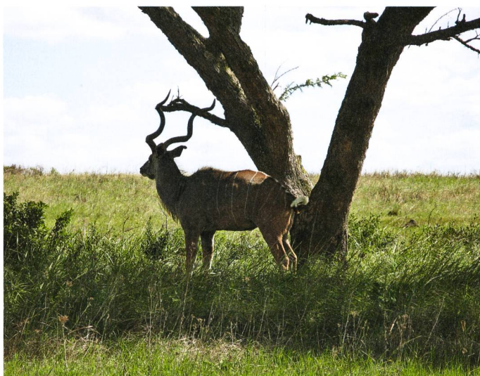
Des rencontres captivantes au Kruger National Park.