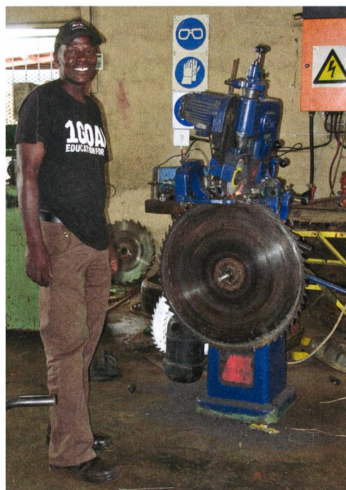
Scierie dans la région de «Lüneburg».

Visite de Caledon, célèbre pour sa culture du blé. A Caledon se trouve le plus important silo à céréales d'Afrique du Sud.