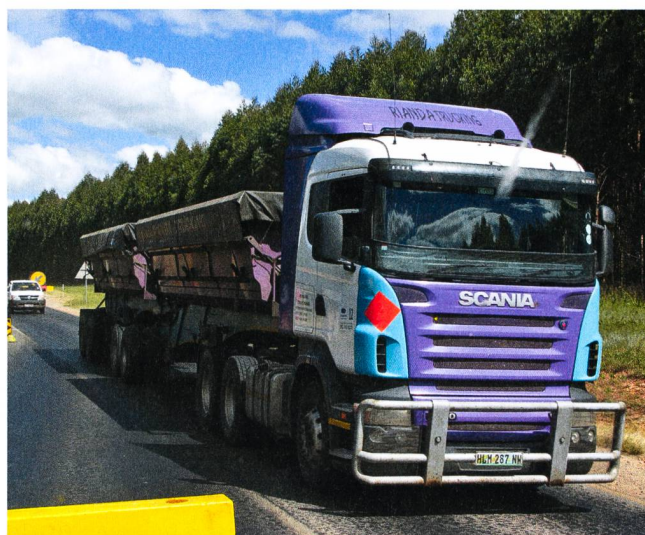
L'Afrique du Sud et son économie, la plus puissante du continent.