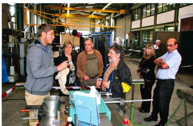
Müller Metallbau AG: des visiteurs captivés par les explications.