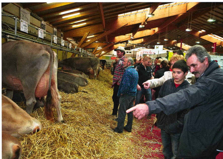
A Suisse Tier, les quelque 180 exposants attendent près de 13 000 visiteurs.