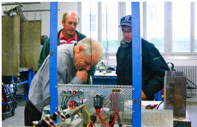
Programme varié au centre ASETA: ici «Installations électriques».