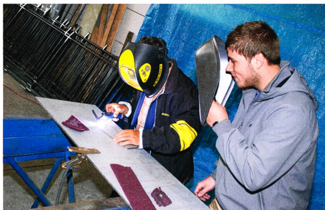
La main ... aux outils avec les conseils préalables de l'instructeur.