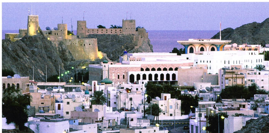
Muscat, un reflet des contes des Mille et une Nuits.