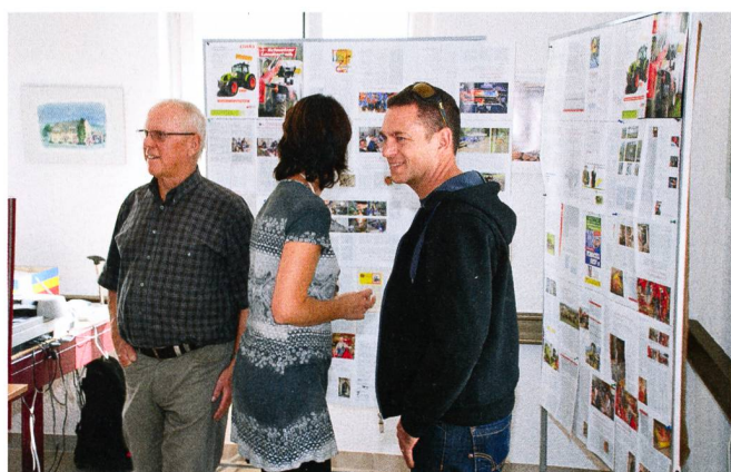
A la rédaction: «Comment se fabrique Technique Agricole »?