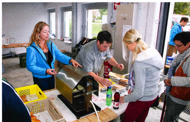
Le «pain+raclette»: une des spécialités du jour.