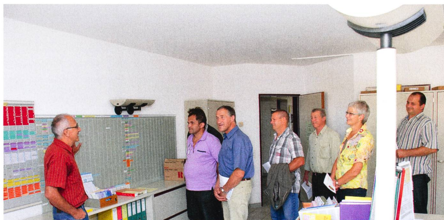
Quelques membres ASETA ont profité des Portes ouvertes pour visiter le centre de Riniken.