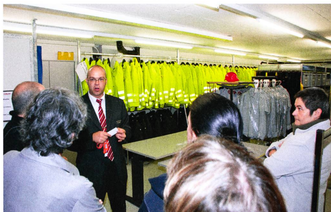
Daru-Wache AG: des auditeurs attentifs pour la visite guidée.