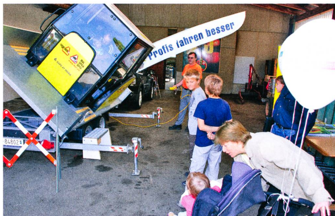
La cabine «basculante» du SPAA, toujours en mouvement!