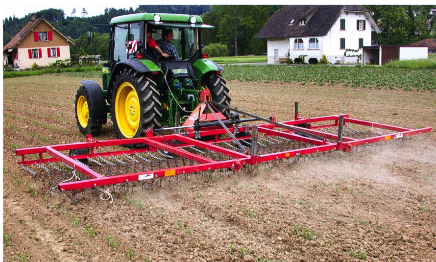
La herse flexible se prête bien à un usage précoce pour casser la croûte du sol et détruire les germes d'adventices.

cultures sur buttes. Les rangées antérieures et postérieures n'exercent pas toujours une pression uniforme. Ces instruments répondent à la plupart des exigences posées dans les exploitations de grandes cultures classiques, sans cultures en buttes. Equipés d'une tôle niveleuse et combinés avec un semoir Krummenacher, ils permettent en outre de pratiquer des sursemis.