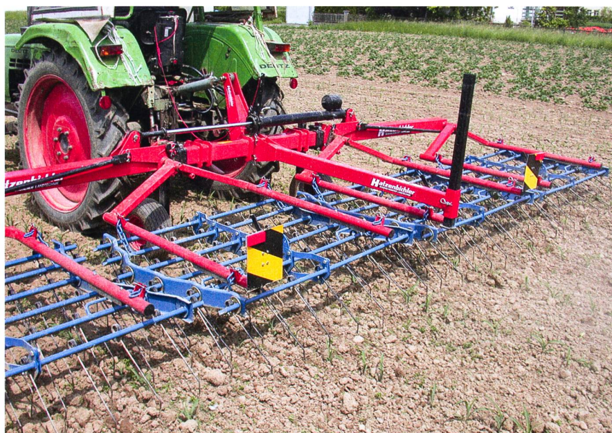
Ces dernières années en Suisse, la « Hatzenbichler » a acquis le statut d'outil standard. Cette herse étrille présente un bon rapport qualité-prix.

Apparue il y a une vingtaine d'années, une nouvelle génération de herses étrilles a marqué une avancée majeure ; ces machines sont constituées de cadres indépendants de 1,5 m de large et sont dotées d'une poignée centrale pour le réglage de la pression au sol. Les instruments des différentes marques Haruwy, Einböck, Köckerling ou Hatzenbichler ne se distinguent que par la longueur et la forme de leurs dents. Les distances entre les voies de passage des dents vont de 2,5 à 4 cm, les dents ont 6 à 8 mm de diamètre, pour une longueur de 50 cm. Elles ont toujours une certaine liberté de mouvement pour intervenir sur des types de sols très divers. Un de leurs inconvénients : il est impossible de régler individuellement la pression des dents et il est donc mal aisé de les utiliser dans les