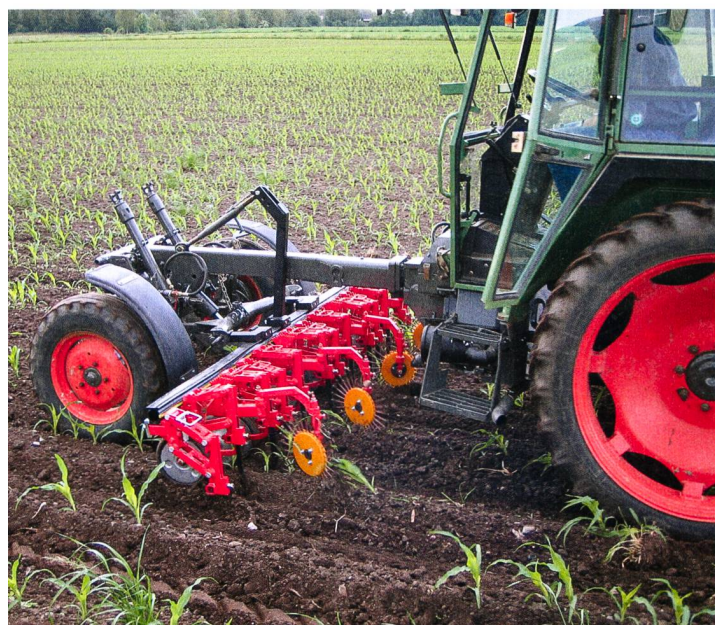
Les étoiles atteignent des vitesses de rotation et une efficacité élevées.