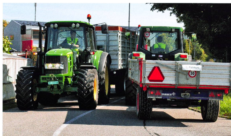
Et ça alors, c'est correct ? Ou alors trop étroit, voire dangereux ?