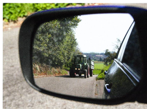
L'agriculture est partout, dans les champs et sur les routes.

Le trajet se poursuit jusqu'au milieu de la localité. Par cette belle et chaude journée, il y a du mouvement dans tous les