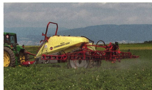
Alphatec le crie haut et fort : les commandes électroniques sont indispensables pour les traitements des cultures !

Le développement d'Alphatec, basé sur le financement propre par ses actionnaires, se veut résolument indépendant. A l'avenir, le développement de produits propres sera encore accentué. Alphatec est conscient que la guerre des prix sur le marché de la machine agricole va encore gagner en intensité, et afin de faire face au mieux, garde une option sur d'autres secteurs de l'agriculture. ■