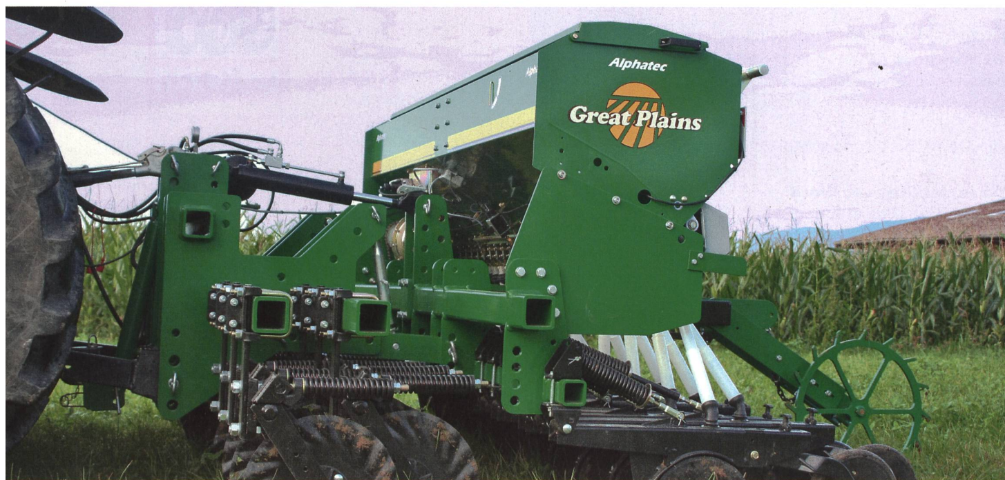
Alphatec : commerce et construction de machines agricole. Combinaison de semis direct montée sur un châssis très robuste de fabrication « maison ». (Photo d'usine)