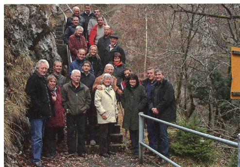
Alphatec : une équipe au service de l'agriculture.

construction apporte une meilleure stabilité dans la pente et améliore la maniabilité de l'outil. Ces caractéristiques sont primordiales sur le marché suisse.