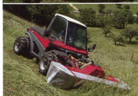
Terratrak Aebi TT140/TT240