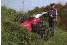
Combicut Aebi CC56/CC66