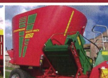
Verti-Mix tapis-C pour des crèches jusqu'à une hauteur de 1.40 m