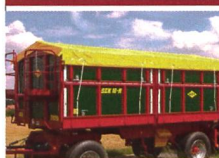
Char basculant 3 côtés à 2 essieux SZK 18-H avec ridelles en bois