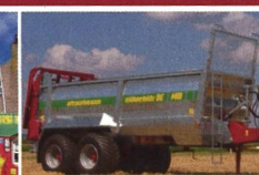
BE 1201 / BE 1401 - la nouvelle grandeur