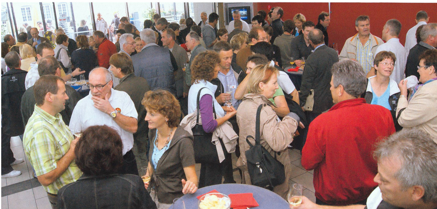
Une bonne occasion de partager ses expériences et son avis.