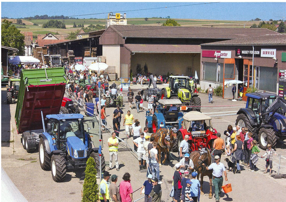
Des conditions de concours parfaites pour la première Fête des tracteurs.