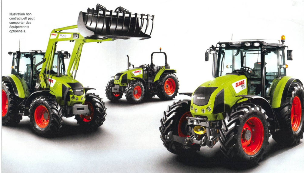
Illustration non contractuelle peut comporter des équipements optionnels.