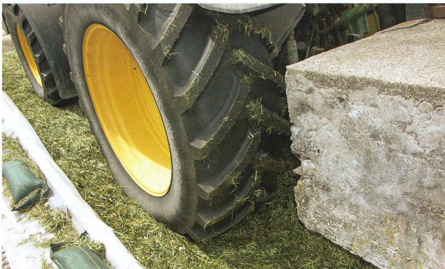
... mais un compactage parfait du silo-tranchée est indispensable.

Les agro-entreprises sont devenues d'incontournables prestataires de services de l'agriculture suisse pour les travaux des champs et la récolte du fourrage. Les clients posent des exigences élevées en ce qui concerne la réalisation du travail en général, et plus particulièrement sur la conservation du fourrage. Que faut-il observer tout spécialement et que doivent savoir les agro-entrepreneurs sur les agents conservateurs d'ensilage?