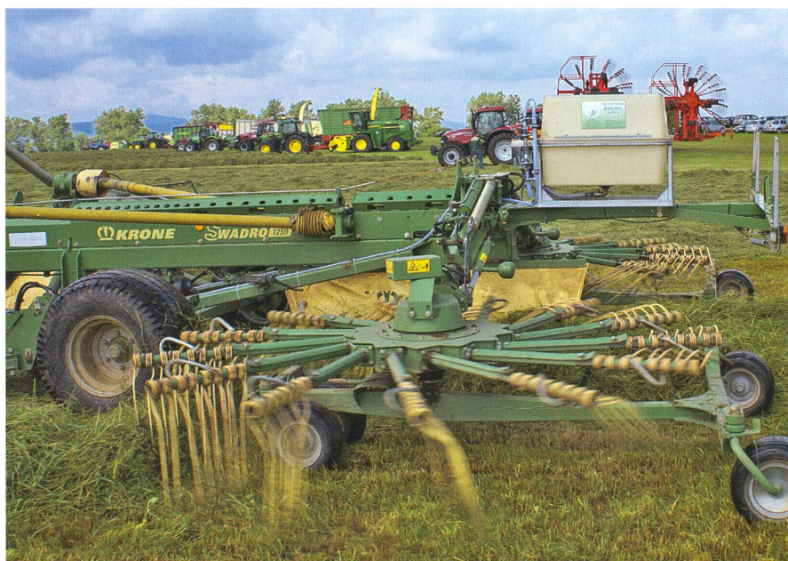
Lorsque des agents conservateurs sont utilisés, le choix du produit, le dosage et la répartition doivent être en adéquation.

propriétés de fermentation biologiques de différentes plantes fourragères, les mesures pour influencer le processus de fermentation et la maîtrise du remplissage et de la fermeture étanche des silos. Des exercices pratiques d'appréciation de la qualité des ensilages et de silos remplis complètent ces séminaires. Si ce type de cours fera l'objet de demandes, l'Association Agro-entrepreneurs Suisses devra réfléchir sur l'opportunité d'en organiser en Suisse. ■