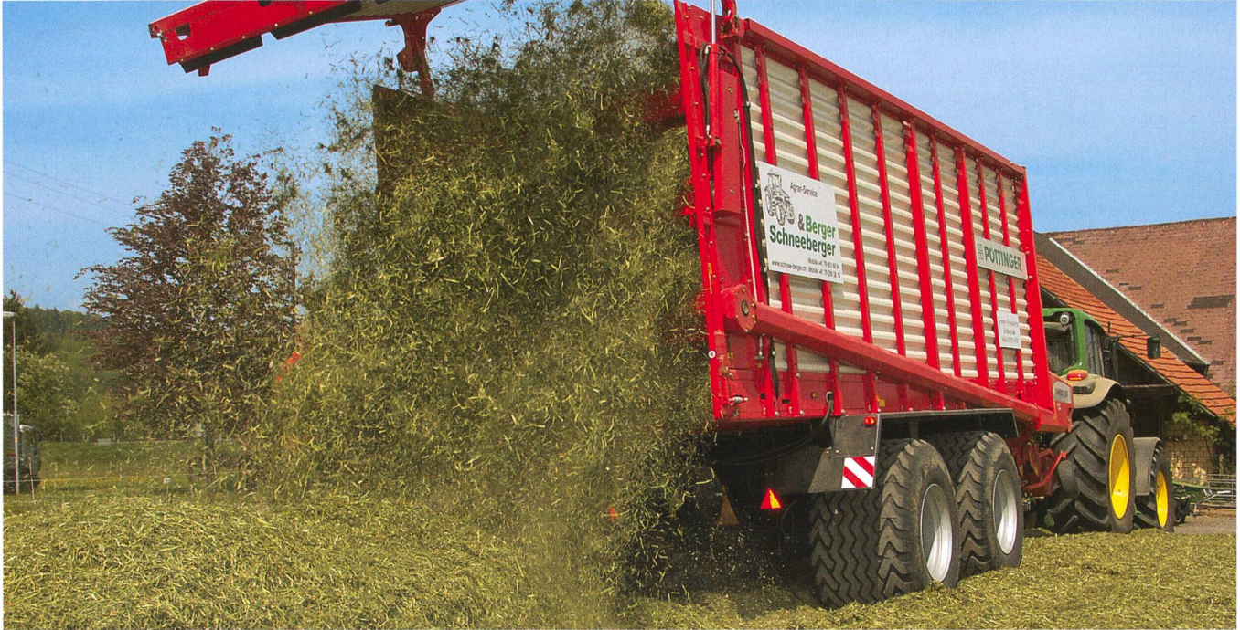
Un rendement élevé assure la meilleure qualité...