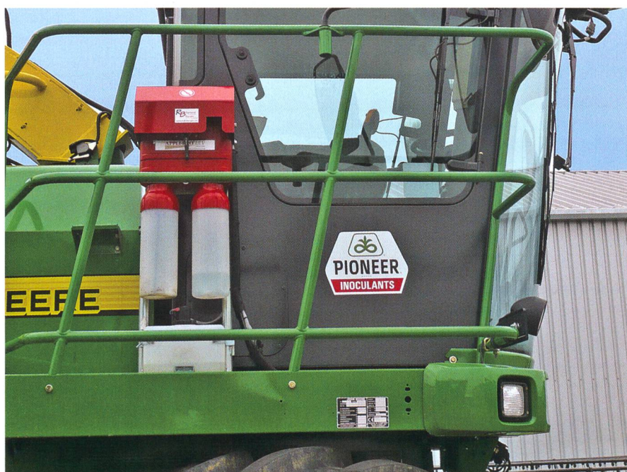
Application des agents conservateurs d'ensilage: la technique avec doseur à volumétrie ultra basse ne peut s'utiliser qu'avec les ensileuses.