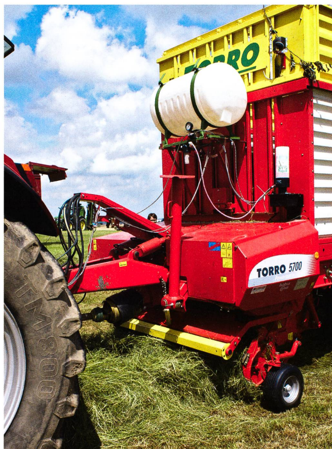
Appareil de dosage pour une répartition homogène des agents conservateurs.