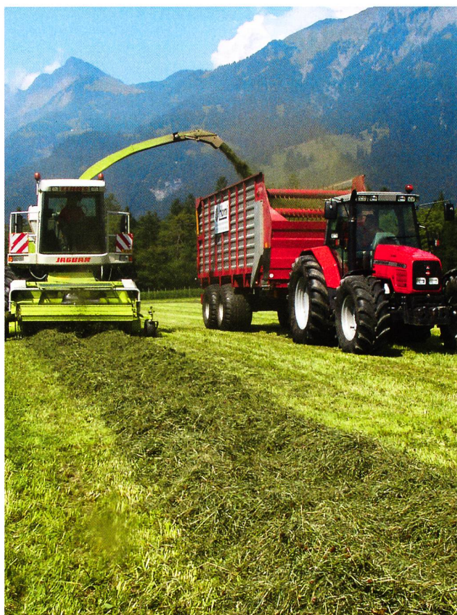
Couper court favorise un bon compactage et évite les fermentations indésirables.

Les levures et les moisissures ne pouvant proliférer qu'en présence d'air, l'étanchéité du silo ou des balles joue un rôle primordial. S'agissant des silos tours, on veillera à une parfaite herméticité des portes (joints). En silos couloirs, la qualité des ensilages dépend beaucoup d'une couverture soignée, étant donné l'importance de la surface. Quant à l'ensilage en balles, il importe d'enrubanner