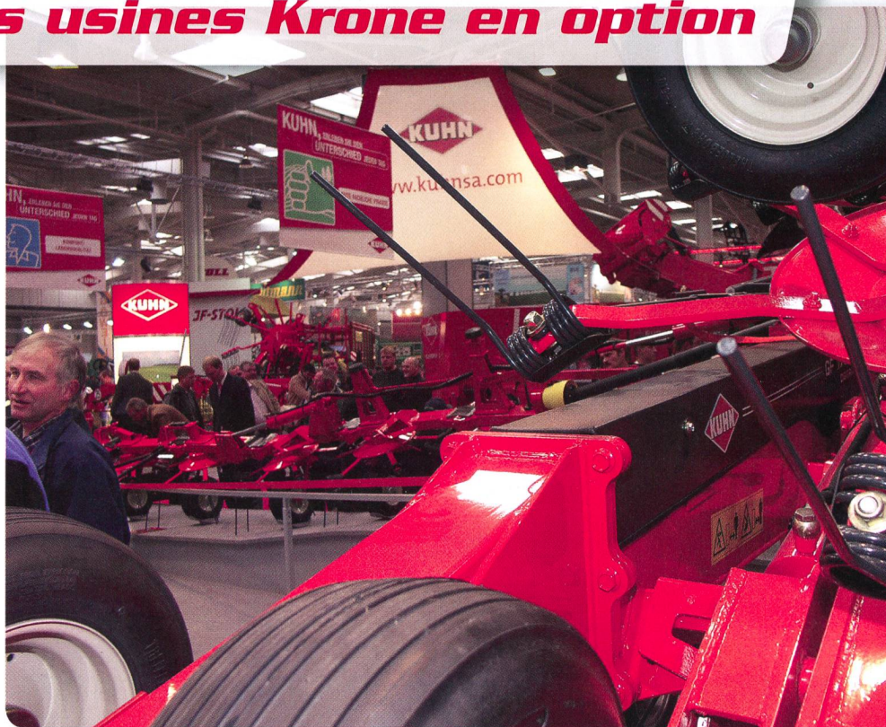
Agritechnica: Tout pour vous satisfaire.

Retour en Suisse l'après-midi, en train ICE