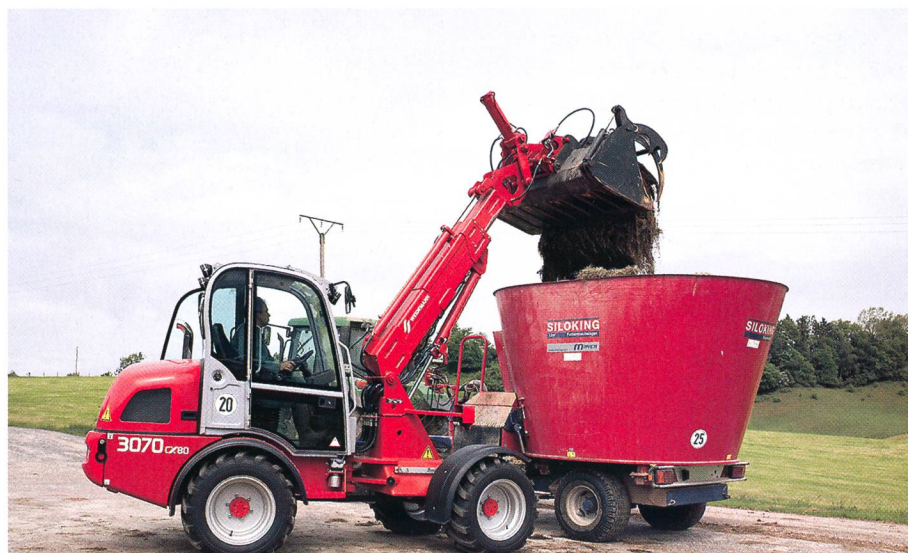
Weidmann: Ces chargeurs de ferme alimentent les remorques d'ensilage de toutes les hauteurs.

Dans la branche des machines agricoles, JCB Landpower (GB) est le plus important constructeur de machines de chantier avec 2,1 milliards d'Euro en 2005. Le programme de la technique agricole du secteur JCB «Landpower» comporte des chargeurs à pneus, des chargeurs télescopiques, des chargeurs compacts et le tracteur rapide «Fasttrac». L'importateur JCB en Suisse est depuis peu Akimat AG à Oberbipp. Dans le domaine de la logistique agricole, JCB se distingue comme le seul fournisseur un assortiment complet: les chargeurs télescopiques JCB comprend 15 modèles avec des hauteurs de levage de 4 à 9,5 m, une largeur de travail de 2,60 à 6,50 m et des motorisations de 50 à 125 CV. Dans le domaine des chargeurs de ferme, on trouve des chargeurs compacts à chenille, ainsi que des chargeurs compacts à pneus articulés et les chargeurs