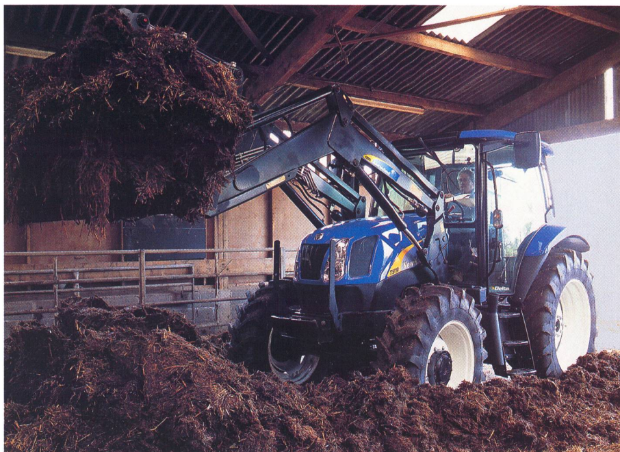
New Holland: Chargeur frontal du tracteur, utilisable universellement.

Les bons chargeurs de ferme sont faciles à utiliser, simples à entretenir, fiables et surtout, grâce au positionnement central du siège du conducteur et au suivi précis de la remorque arrière, ils offrent une excellente visibi-