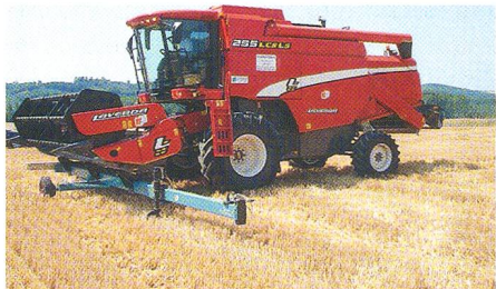
Le nouveau modèle 255 LCS de la série INTEGRALE de LAVERDA . Avec une compensation latérale de 20% et longitudinale de 8%, cette moissonneuse-batteuse remplira la plupart des exigences. Le moteur INVECO NEF garanti une puissance suffisante; la barre de coupe est équipée de l' APS pour le guidage.

BRIRI produit des citernes à pression et des épandeurs . Un savoir-faire qui permet de construire des citernes à pression avec rampe à pendillards équipées notamment de régulateur électronique de débit, correcteur de dévers, essieu tridem autodirecteur avec régulation de pression des pneus à distance, commandes par CANBUS.