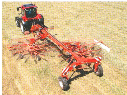
Articulation guidée du cardan pour une meilleure adaptation au sol

Les nouveautés de KUHN: le grand giro-andaineur G8020, à andainage latéral avec entraînement hydraulique et des commandes tout confort s'adapte parfaitement aux dénivellations grâce à l'articulation guidée du cardan. La faucheuse conditionneuse portée FC 283 TG s'adapte à tous les genres de sols et à des vitesses de travail élevées. Le semoir mécanique porté KUHN Integra G II est doté d'un contrôle précis de la profondeur de dépôt grâce au réglage continu de la profondeur maximale. Les deux nouveaux broyeurs avec attelage avant ou arrière: le BPR 280 pour de gros travaux et un entretien minime et le BKE 250 REV pour l'entretien des prairies et des pâturages.