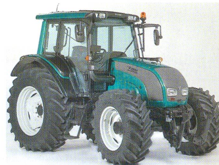
La série N présentée au printemps 2006 est prometteuse.

Le modèle Advance offre au client une gestion hydraulique, avec commande sur le nouvel accouoir. Il est équipé d'une pompe hydraulique de 115 l/min avec système Load-Sensing ainsi que de 4 distributeurs proportionnels (au maximum) avec réglage électronique de la durée de fonction programmable (2 d'entre eux sont commandés par joystick). Sa force de levage est de 7700 kg; le changement de groupe est facilité sur la boîte de vitesses. L'équipement est complet, entre autres, par de nombreux accessoires comme le poste de conduite inversé (nouvelle conception), la suspension de l'essieu avant, le relevage et la prise de force à l'avant, le Cruise Control, le terminal ISOBUS et les chargeurs frontaux livrables au départ de l'usine.