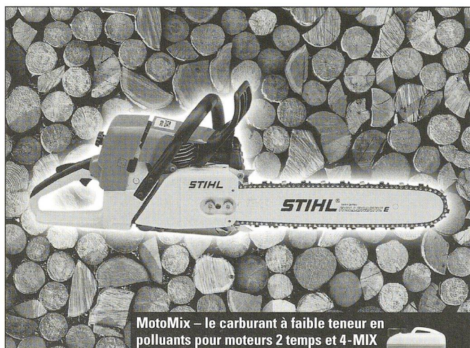
MotoMix – le carburant à faible teneur en polluants pour moteurs 2 temps et 4-MIX